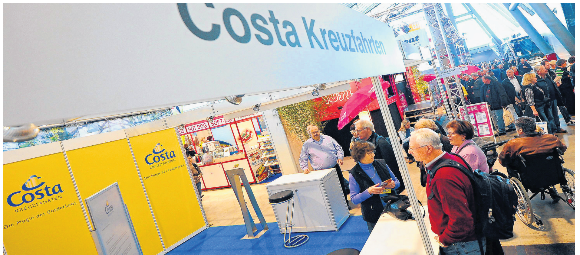
Kein Personal, keine Prospekte: der Messestand von Costa in der Halle acht der CMT ist geschlossen.