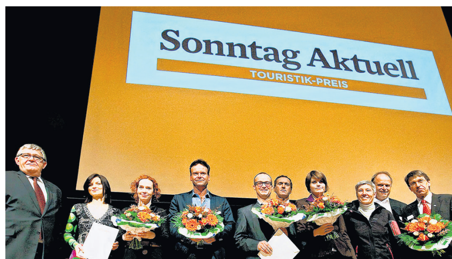
Die stolzen Preisträger haben die originellsten Reisen präsentiert.

Joey Kelly – vom Bandmitglied und Geschäftsführer der Kelly-Family zum Extremsportler mutiert – berichtete in einem verbalen Hochgeschwindigkeitsmarathon über seine Strapazen im Death Valley, in der Wüste und am Südpol sowie von seinen 900 gelaufenen Kilometern ohne Geld und Proviant von Wilhelmshaven bis zur Zugspitze. „Nur der Wille zählt“, lautet Kellys Losung, mit der er seine eigenen Grenzen überwindet. Um sehr viel komfortableres Reisen geht es auf dem neuen Internetportal von „Sonntag Aktuell“ mit Hintergründen und Insider-tipsps unter www.fernweh-aktuell.com .